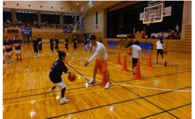
「新潟アルビレックスBBの選手による 小学生向けバスケットボール教室の様子」