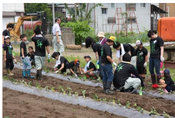
「どろんこキッズスクールの様子」