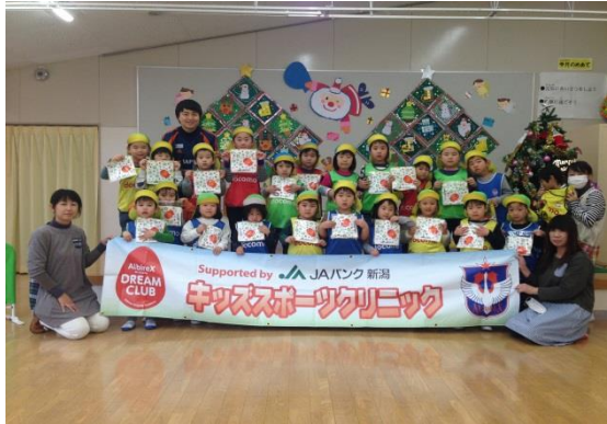
「アルビレックス新潟のコーチ・スタッフによる 保育園・幼稚園児向けのサッカー教室の様子」

「スポーツを通じた青少年の健全育成」の趣旨に賛同し、アルビレックス新潟（サッカー）及び新潟アルビレックスBB（バスケットボール）が開催する「スポーツ教室」への特別協賛を行っています。