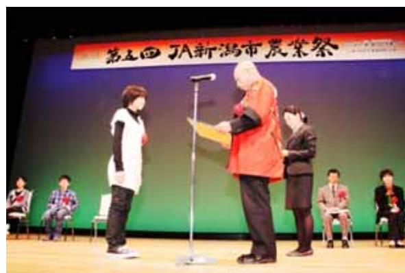
農業祭での表彰式