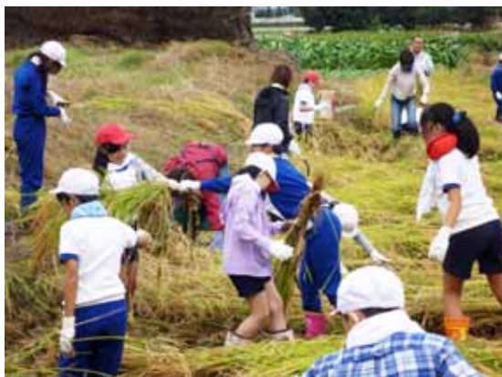
学校教育田での稲刈り体験