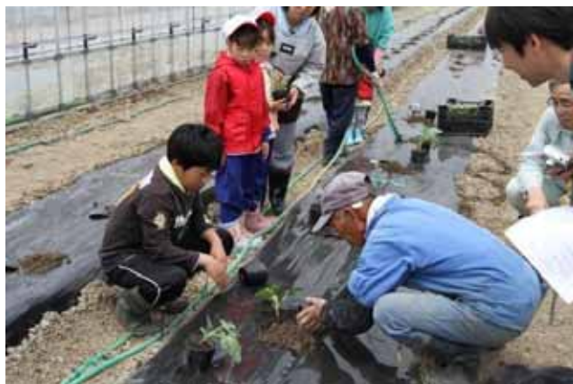
苗の植え付け体験